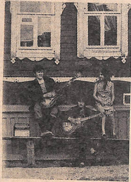
«ТРИ О»