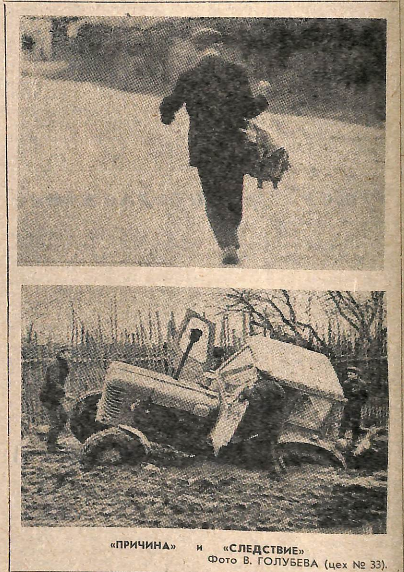
«ПРИЧИНА» и «СЛЕДСТВИЕ» Фото В. ГОЛУБЕВА (цех № 33).